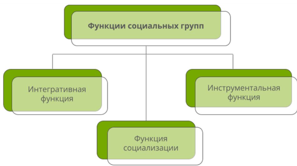
Рис. 1. Функции социальных групп

В жизни каждого человека и общества в целом социальные группы выполняют несколько важных функций.