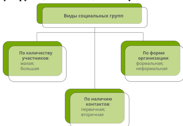
Рис. 1. Виды социальных групп

Социальная группа — это объединение людей, которые связаны общим значимым признаком, осознают свою принадлежность к данной группе и следуют определённым правилам, регулирующим взаимодействие участников.